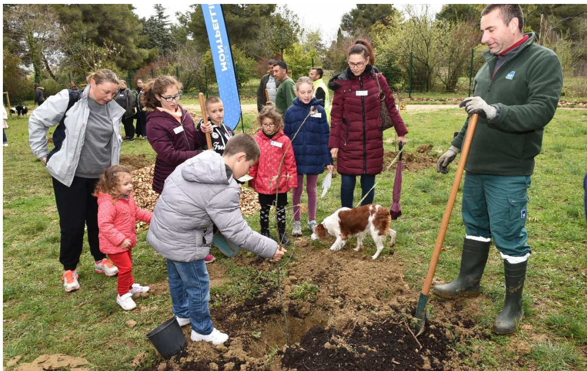
Plantation participative au parc Montcalm en mars 2018.