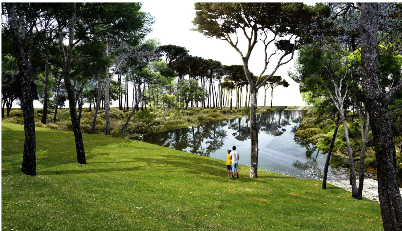
Le parc René Dumont sera équipé d'un bassin de rétention d'eau de pluie.

Les arbres plantés sont des pins parasols, des pins d'Alep, des chênes pubescents, des chênes chevelus, des gymnocladier dioïque, des arbusiers et des chênes à feuilles de myrsine. L'arbre planté par Philippe Saurel le 20 mars est un Gingko Biloba.