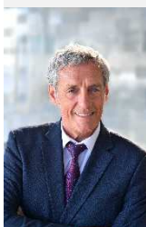
Maire de Montpellier Président de Montpellier Méditerranée Métropole

« Montpellier Cité Jardins » permet à chacun de verdir nos quartiers par de multiples actions, dans les parcs mais aussi juste en bas de chez soi, grâce aux 500 premiers permis de végétaliser que nous attribuons ce printemps. C'est tout un écosystème que l'on protège avec ces réservoirs de biodiversité. C'est ainsi par un engagement collectif que nous ferons de Montpellier une ville plus accueillante, plus belle, plus respirable. Ensemble, végétalisons nos quartiers ! »