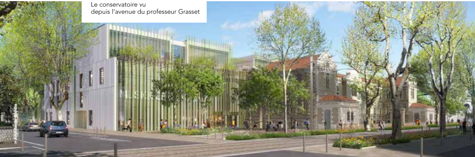
Le conservatoire vu depuis l'avenue du professeur Grasset

Au sein du quartier Boutonnet, abrité au cœur de l'ancienne maternité Grasset réhabilitée pour l'occasion et étendue par une construction moderne, le conservatoire profitera d'une surface de plancher totale de près de 9800 m 2 . Suite à une mise en concurrence, la SA3M mandataire du projet, a confié la réhabilitation et l'extension au groupement rassemblant Architecture-Studio et MDR. Quant à Base, ils ont été retenus au titre de paysagiste. Alors qu'en façade, le long de la ligne 1 de tramway, c'est bien la partie historique du bâtiment qui sera visible, derrière, lui sera accolée une construction en verre. Cette partie principale du conservatoire, équipée de multiples salles d'enseignement, d'auditoriums et de studios, sera ponctuée de patios et de terrasses ouvertes sur le square arboré au sud, et le vaste parvis d'entrée au nord. L'ensemble met la transparence et le végétal au cœur du projet. En termes de forme, pour se fondre dans son environnement, ce seront des petits pavillons qui seront construits, positionnés les uns à côté des autres, le long d'un axe central. À l'entrée, une petite placette sera aménagée pour répondre à la placette actuelle à l'arrêt de tramway Boutonnet.