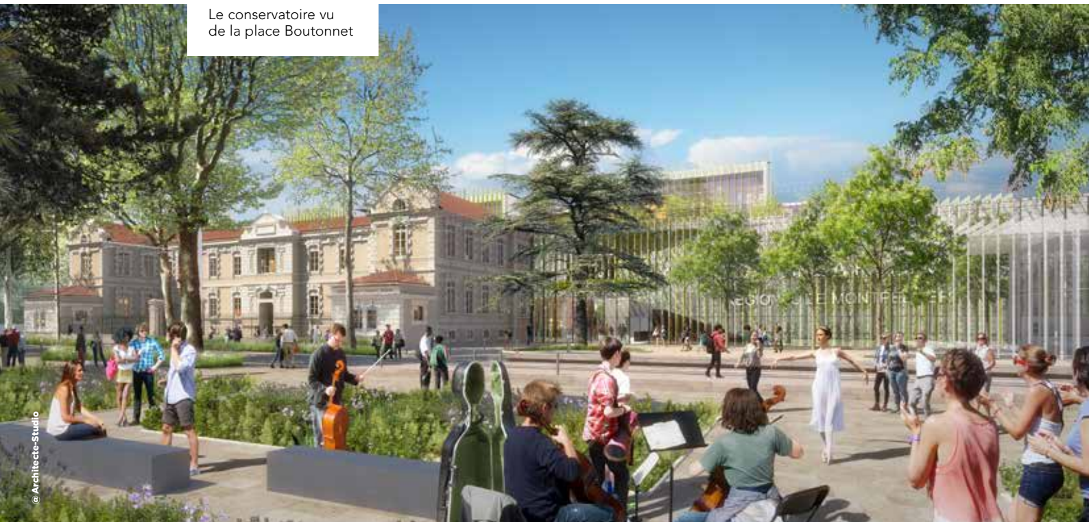
Le conservatoire vu de la place Boutonnet